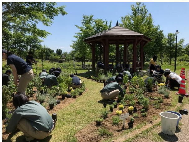
2019 5/24 植栽 約20品種の植物を植栽しました

カレーの香りがするカレーブランドやレモンの香りがするレモンバーム（黄金葉）が人気でした。今後の計画の参考になりました。