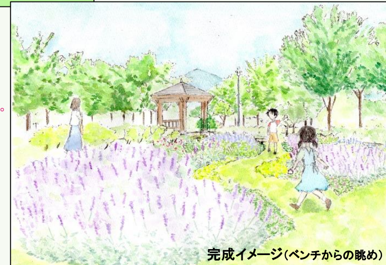
完成イメージ(ベンチからの眺め)

イメージ描写位置にはベンチがあり、そこからの眺望は、ガーデン全体が見渡せ、木々の向こうには八海山をはじめとする越後三山が望める絶景ポイントとなっています。