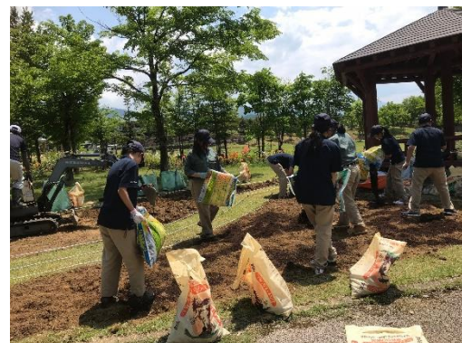
2019 5/17 土壌改良 建設残土のため、石だらけ。除去後、 学校オリジナルのもみ殻堆肥を混合 ふかふかな土になりました。