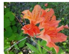
八色ツツジ【落葉低木】 開花期5～6月

香る方法は嗅覚だけでなく、触れて香るものや味覚で感じるものもあります。当ガーデンでは、自由に植物とふれあいその経験を通して、関心を高めて頂きたいです。そのひとつとして、植物の情報表示板を設置し、より多くの人に香り植物の情報を活用していただきたいと思います。また、既存の「八色ツツジ」はレンゲツツジの一種で、魚沼地域で昔から愛されている美しい花木です。しかし現在その姿は衰退傾向にあります。「八色ツツジ」をより多くの方に周知することもこのガーデンの役割と考えています。