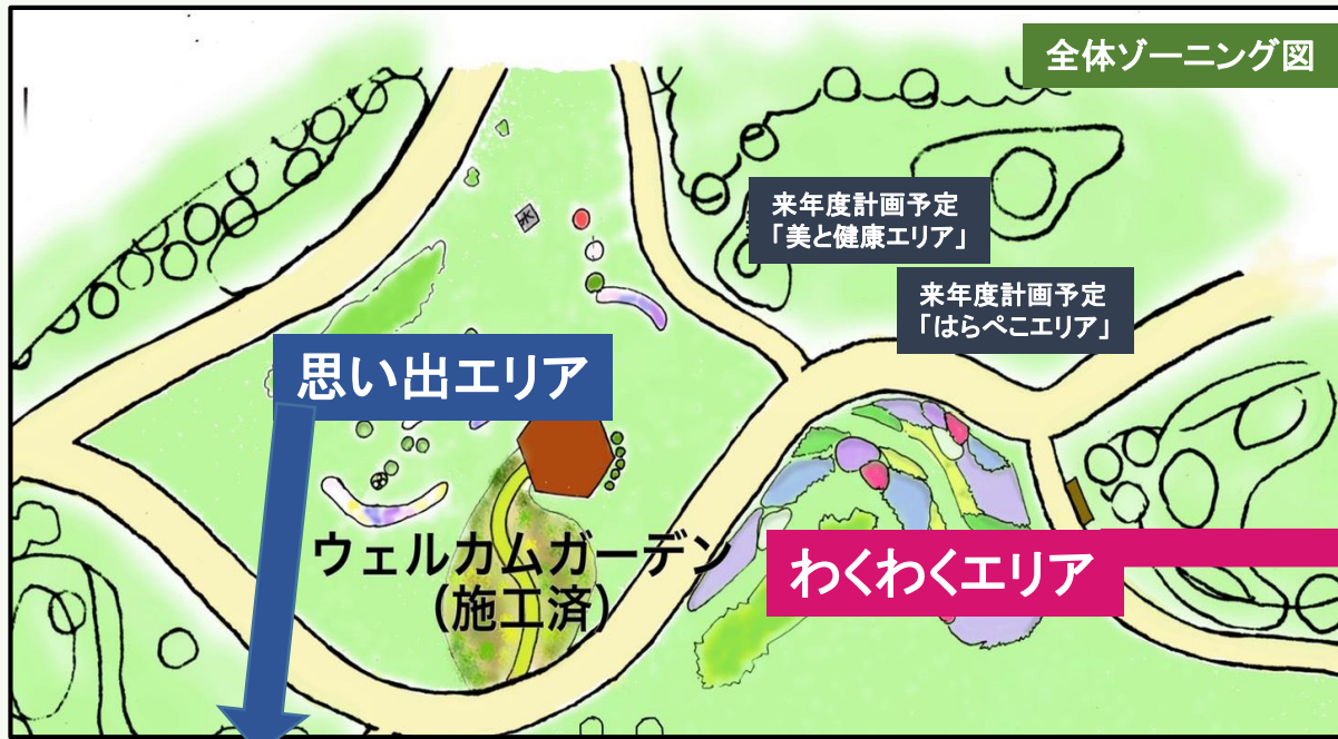
全体ゾーニング図

企画団体 新潟農業・バイオ専門学校 共同企画団体 奥只見レクリエーション都市公園 指定管理者 むつみグループ